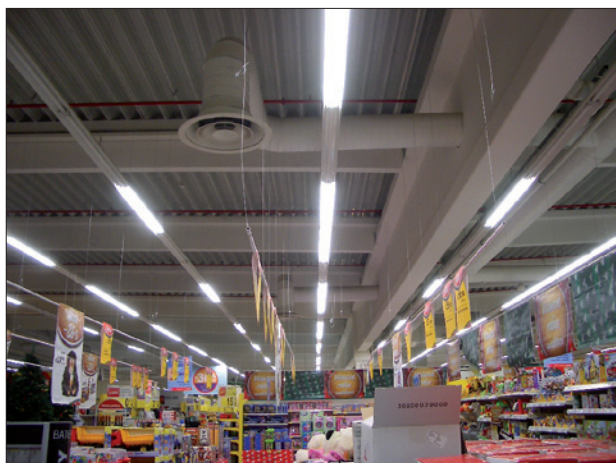
Obr. 3. Hypermarket v Ružomberku před instalací regulace; způsob regulace v minulosti spočíval ve vypínání části osvětlení