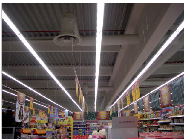
Obr. 4. Hypermarket v Ružomberku po instalaci regulace; v současnosti je regulace založena na hromadném rovnoměrném stmívání svítidel v celém prostoru