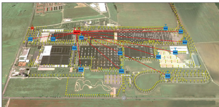
Obr. 3. Umiestnenie svietidiel, rozvádzačov a veľína

SEAK – Ing. Jozef Sedlák Odborárska 22, 080 01 Prešov Slovakia tel.: +421 517 715 065 fax: +421 517 742 674 mobil: +421 905 787 230 e-mail: seak@seak.sk www.seak.sk