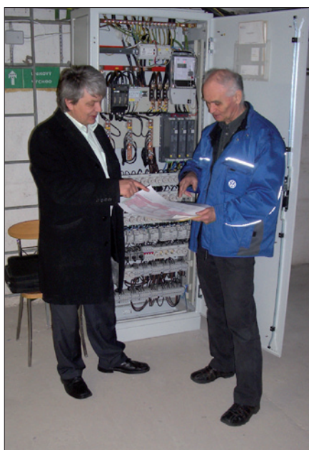
Obr. 1. Zahájenie skúšobnej prevádzky

Po úspešnej realizácii energetického opatrenia regulácie vnútorného osvetle-