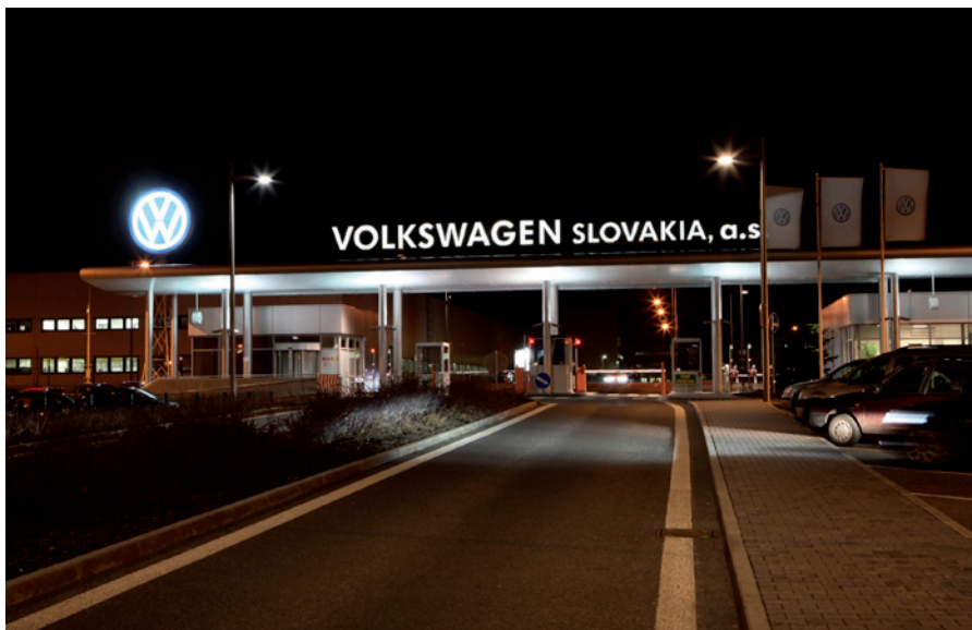
Obr. 2. Vonkajšie osvetlenie areálu VW SK pozostáva z 983 svetidiel

„Bolo nám jasné, že osvetľovanie vonkajších priestorov má veľké rezervy, čo sa týka možnosti úspor elektrickej energie. Požadav-