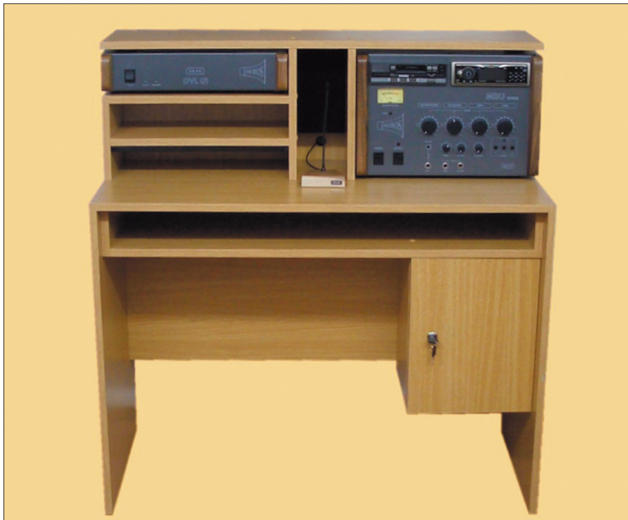
Rozhlasová ústredňa MRU Beros

atmosféru a prilákať ďalších občanov na podujatie. Alebo, koná sa púť na nejakú svätú horu v blízkosti obce. Nie každý, a tobôž starší, sa na takúto púť odhodlá. Schopný starosta cez obecný rozhlas urobí reportáž v priamom prenose prípadne aj s omšou. Ale to len v tom prípade, ak bude mať náš telefónny ovládač. Takáto reportáž sa dá robiť aj z letného kúpaliska, z lyžiarskeho svahu, dokonca aj z pohrebu, ale to si musí starosta dôkladne zvážiť.