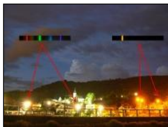
[600x450] Porovnání spektra rtuťové a nízkotlaké sodíkové výbojky Autor: Ladislav Gagyi

V minulých odstavcích jsme si řekli, že gangliové buňky jsou citlivé především na modrou oblast spektra. Proto je důležité, abychom v noci toto světlo vnímali co nejméně. Jak toho docílit? Někteří autoři doporučují používání oranžových brýlí v nočních hodinách, které utlumují modrou část spektra, ale naopak oranžovou barvu, takovou jakou má většina pouličních lamp propouštějí. Pokud ale nechceme být všem za blázny, náprava musí být jinde, v samotných svítidlech! Světelné zdroje by se měly používat ty, které onu modrou složku neobsahují - jsou to například nízkotlaké sodíkové výbojky. Vydávají oranžové monochromatické (složené pouze z jedné spektrální barvy) světlo, které sice nemá dobré barevné podání a moc se nehodí například pro osvětlení provozů a podobně, ale pro osvětlení sídlišť bohatě dostačuje.