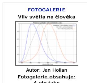
Autor: Jan Hollan Fotogalerie obsahuje: 4 obrázky